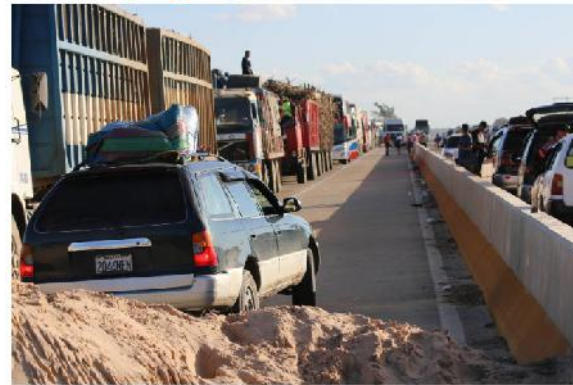
Decenas de camiones están parados debido a los bloqueos en Buena Vista.