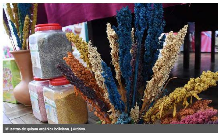
Muestras de quinua orgánica boliviana.