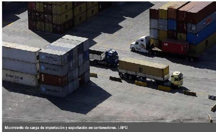
Movimiento de carga de importación y exportación en contenedores.