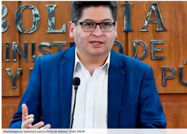
Montenegro es optimista con la oferta de dólares

Gobierno considera que se superó la falta de dólares y trabaja para la llegada de una entidad financiera china. Banco Unión ya opera con la moneda asiática. Privados hacen notar que las comisiones siguen altas