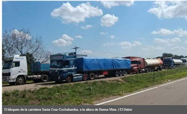
El bloqueo de la carretera Santa Cruz-Cochabamba, a la altura de Buena Vista.