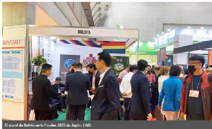
El stand de Bolivia en la Foodex 2023 de Japón.