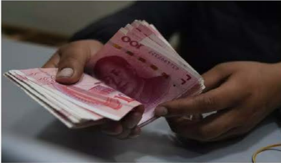
Un trabajador de una casa de cambio cuenta billetes de yuanes chinos en La Paz, Bolivia, el miércoles 26 de julio de 2023. El banco estatal boliviano, Banco Unión, comenzó a aceptar transacciones de comercio internacional usando la moneda China, el yuan.

POR CARLOS VALDEZ | ASSOCIATED PRESS JUL. 27. 2023 5:39 PM PT