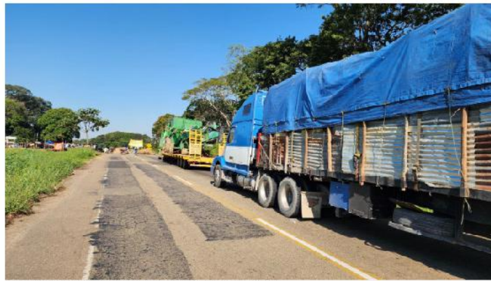
La ruta Santa Cruz-Cochabamba permanece bloqueada.

LA PAZ / 15 de septiembre de 2023 / 23:11