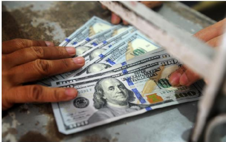
financiero. Una persona deposita dólares en su cuenta en una entidad financiera nacional POR ERIKA IBÁÑEZ