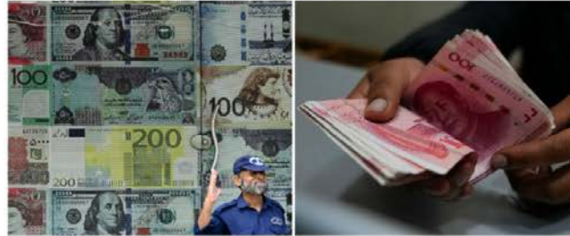
Exportadores bolivianos optan por el euro y el yuan para sus operaciones. Imágenes de un cajero del estatal Banco Unión, en la Paz, y un local de cambio de divisas.