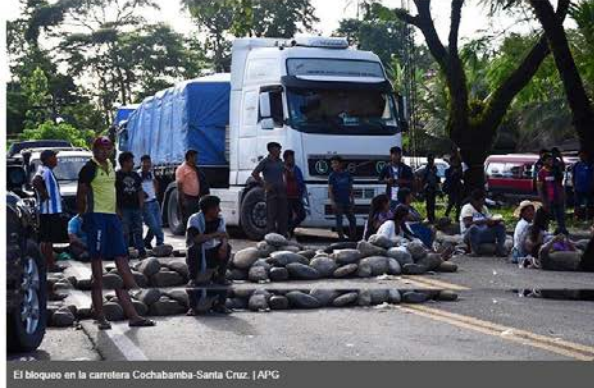
El bloqueo en la carretera Cochabamba-Santa Cruz.