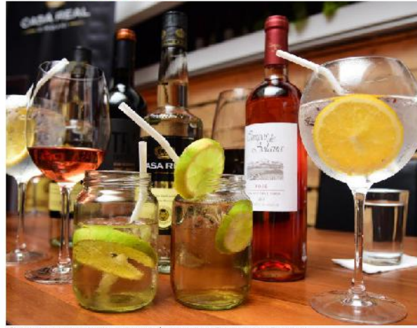
El singani es una de las bebidas bolivianas más apreciadas en Estados Unidos.