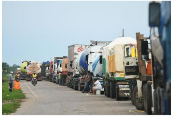
Camioneros de camiones están parados en la frontera por el conflicto en Perú.