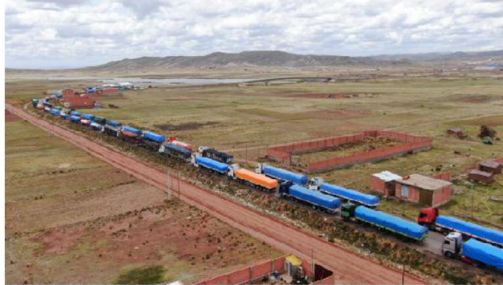
Los conflictos en Perú provocaron problemas para la exportación e importación boliviana.