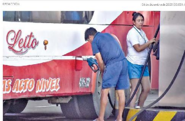
Un transportista carga diésel en una estación de servicio.

Temen que YPFB no cumpla la demanda del agro en época de siembra. Gobierno descarta quitar la subvención de carburantes y CAO plantea cuatro condiciones.