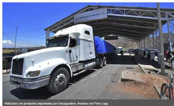
Vehículos con productos importados por Desaguadero, frontera con Perú | app