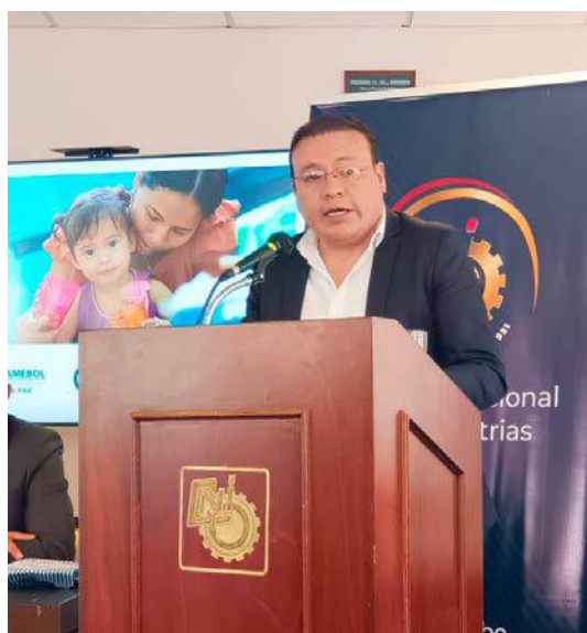
Participación de CANEB y la CNI en el marco de la alianza con UNICEF para la promoción de la lactancia materna y el cuidado cariñoso y responsable de los niños y niñas.