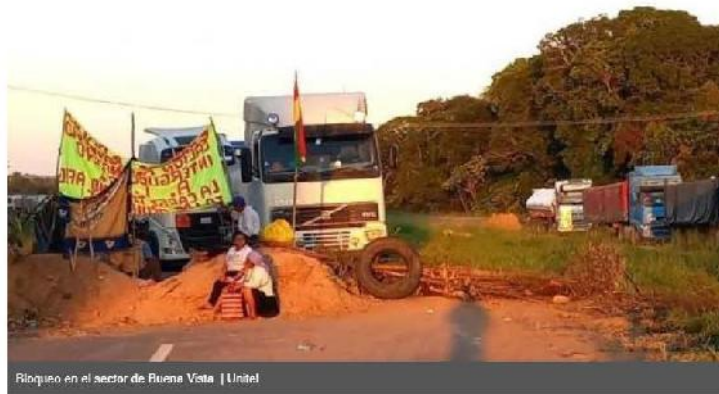
Bloqueo en el sector de Buena Vista